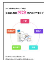
作成したPICSパンフレット