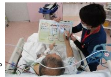
患者と共に目標設定している様子