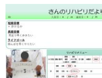
実際のリハビリだより