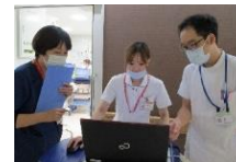
ICU看護師と病棟看護師、理学療法士が連携している様子