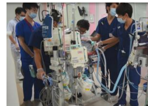
人工呼吸器装着中のリハビリの様子