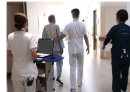
病棟でのリハビリの様子