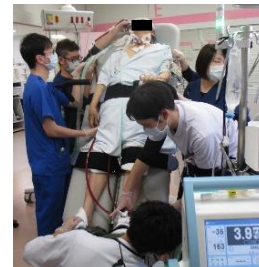
ECMO装着中のリハビリの様子