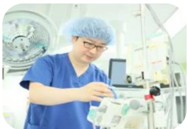
術中麻酔管理領域