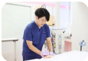
外科術後病棟管理領域